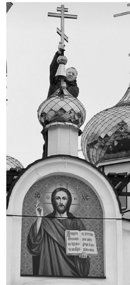
Более 70 куполов поднялись ввысь благодаря мастеру из Константиновки

Татьяна ШИШКАНОВА