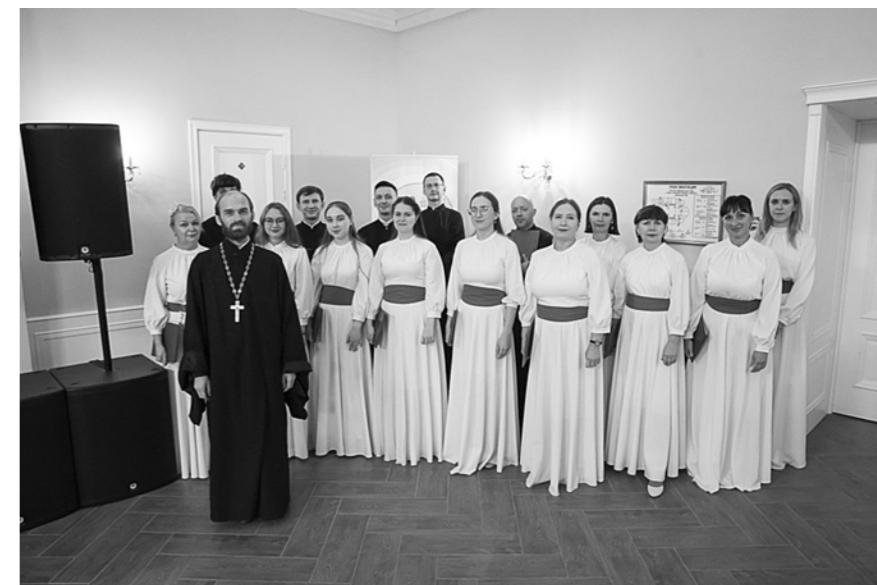
С артистами хора «Спас»

– Сегодня многие, в том числе профессиональные композито-