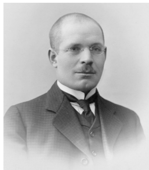
Николай Нилович Бурденко

Сразу две находки – тамбовские корни великого русского хирурга Николая Ниловича Бурденко и наличие у него старшего брата-тезки, умершего во младен-