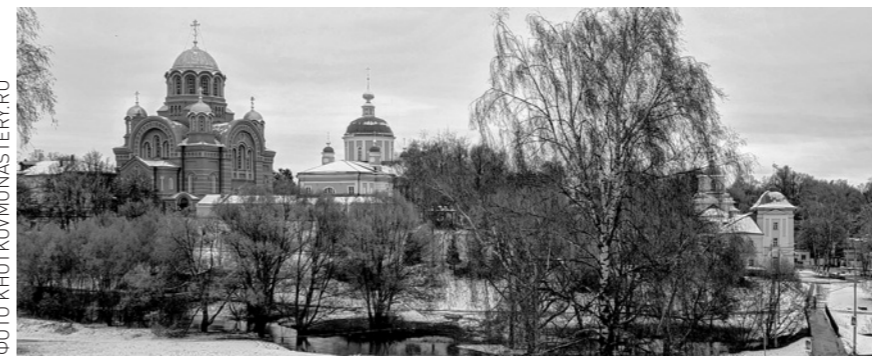
Покровский монастырь. Хотьково. Московская область.

Информация и запись по телефонам: | 8-927-375-3165, 8-927-375-6061, 25-31-65, 25-60-61. Адрес: г. Пенза, Соборная площадь, 1.