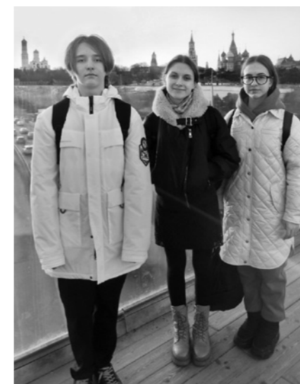
На Парящем мосту

В нынешнем учебном году участникам олимпиады были представлены задания на темы: «Святитель Тихон: духовное наследие и подвиг в эпоху испытаний», «Христианство в воинском служении: примеры святых защитников Отечества», «Сокровища русского искусства: ико-