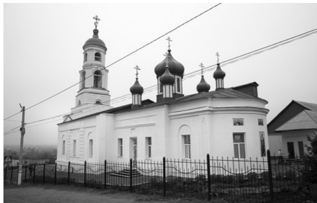
Дмитриевский храм в наше время