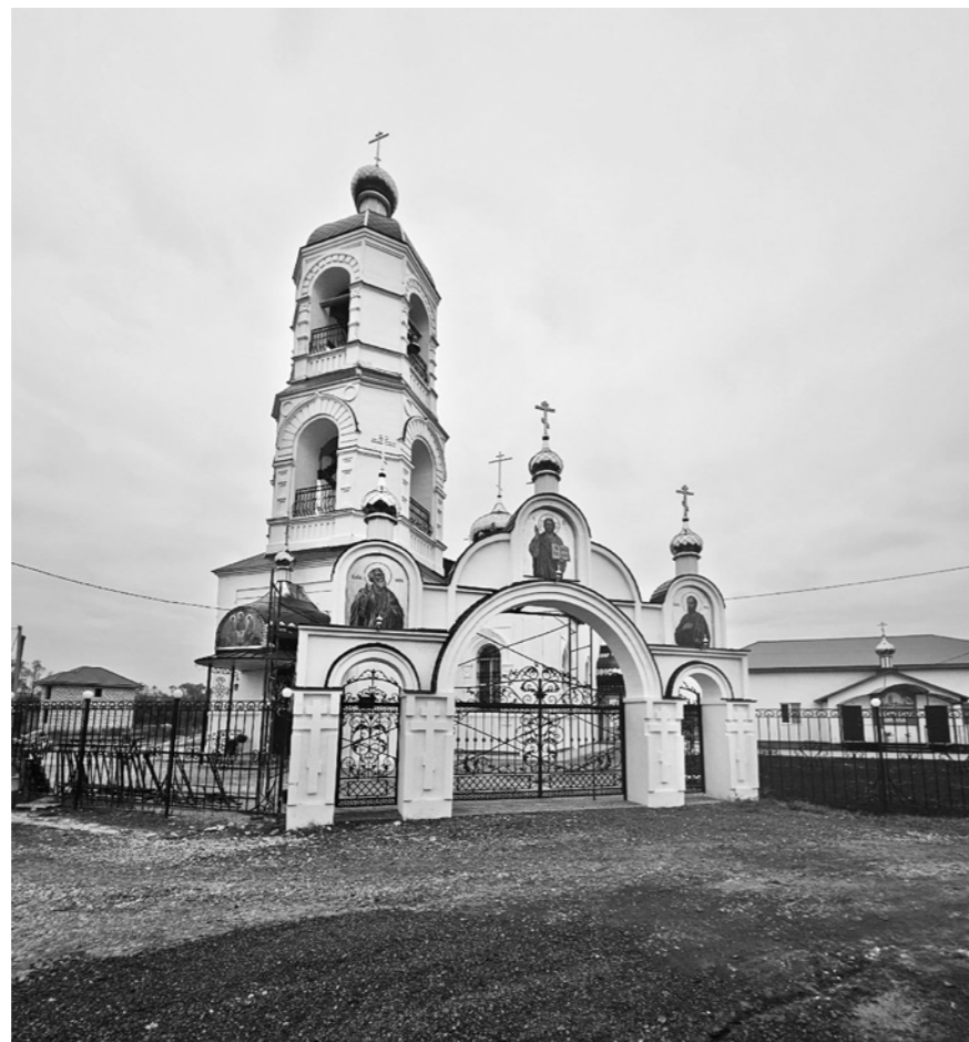
Таким прекрасным стал порушенный в советское время Троицкий храм в Константиновке

– Ведь это памятник истории и культуры, центр духовных традиций, – возражал он. – Здесь души наших предков. Намоленное место.