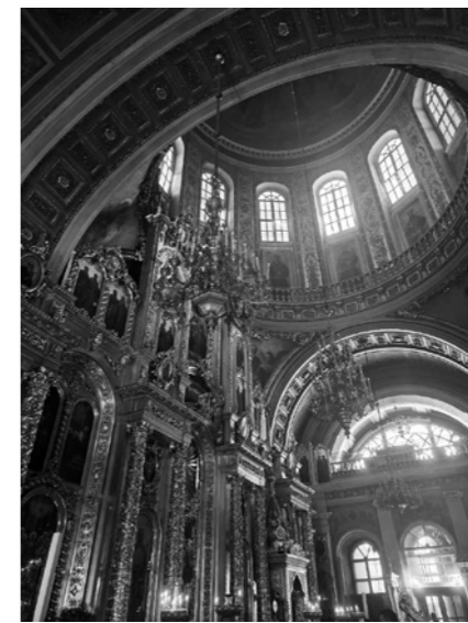
В Богоявленском соборе в Елохове

В перерывах между состязаниями юные пензенцы с радостью воспользовались возможностью посетить достопримечательности столицы. Побывали в Богоявленском соборе в Елохове, где в 1799 году крестили великого русского поэта Алексан-