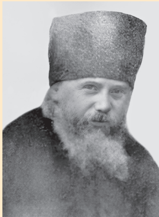
Епископ Пензенский Кирилл I (Соколов)